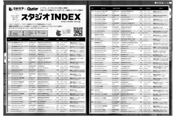
※画像は2013年8月号の誌面になります。